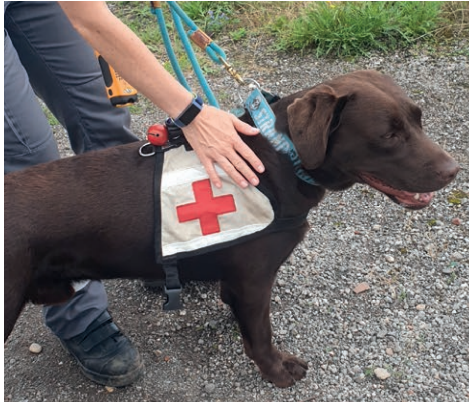
Stolzer Rettungshund Ole