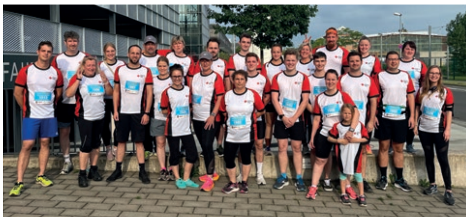
Das Team des DRK Mülheim

Um 19 Uhr fiel bei sommerlichen Temperaturen der Startschuss an der Hochschule Ruhr-West und gut sichtbar mit einheitlichen Teamshirts machten sich alle auf den Weg. Die Stimmung auf